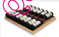
« Coulissante » 13 Bouteilles