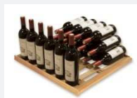
« Présentation » 38 Bouteilles

La clayette AHUI d'ArteVino est équipée d'une porte étiquettes :