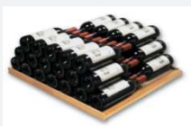
« Empilage » 78 Bouteilles

La clayette AHUI est universelle, elle peut être positionnée en :